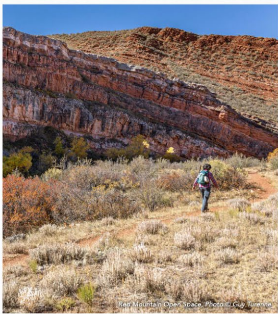
Red Mountain Open Space

Sus acciones, guiadas por estos sencillos consejos de cuidado, garantizarán una experiencia memorable y segura mientras se minimiza el impacto en los valiosos recursos naturales.