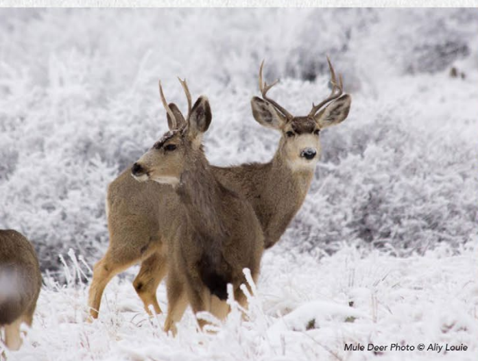
Mule Deer

El aire libre es para todos; Sea cortés con las experiencias de los demás. Mantenga el volumen de la música bajo, tome solo recuerdos y comparta una sonrisa.